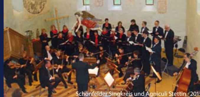
Schönfelder Singkreis und Agniculi Stettin · 2015

Veranstalter: Uckermärkische Musikwochen e.V.