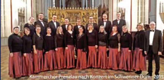
Kammerchor Prenzlau nach Konzert im Schweriner Dom · 2015

Veranstalter: Internationales Orgelfestival Stettin