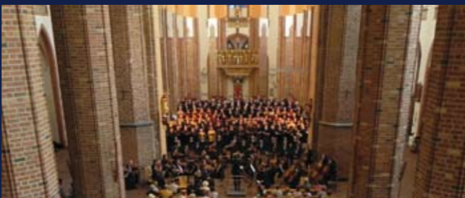
Abschluss des IX. Internationalen Chorfestivals in der Kathedrale Stettin

Veranstalter: X. Internationales Chorfestival Stettin in Zusammenarbeit mit dem Polnischen Chor- und Orchesterverband, dem Deutschen Sängerbund und dem Polnischen Rundfunk