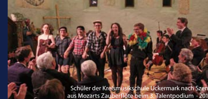
Schüler der Kreismusikschule Uckermark nach Szene aus Mozarts Zauberflöte beim 3. Talentpodium · 2015

Veranstalter: Kultur- und Festspielhaus Wittenberge